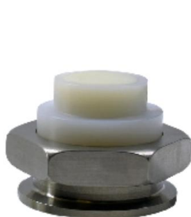
H6 KF-40 Sensor Housing