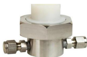
H3 Flow Through Sensor Housing